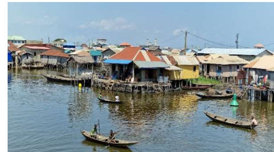
Découverte de la vie des habitants de Ganvié