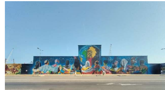
Découverte de la fresque artistique du Port de Cotonou