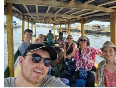
Trajet en pirogue jusqu'au village sur pilotis de Ganvié