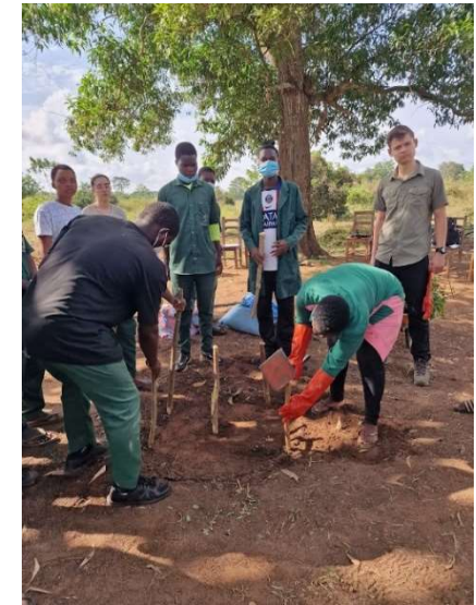
Concrétisation du micro-projet collectif de compostage in situ