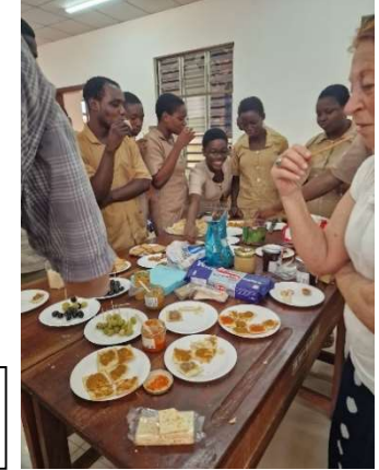
Rencontre des élèves et échanges interculturels