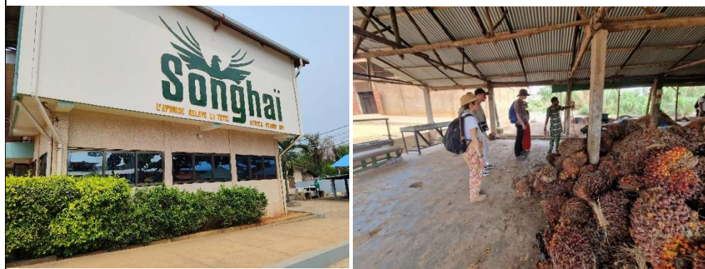
Visite de la ferme agroécologique de Songhaï et des ateliers de transformation (ici huile de palme)