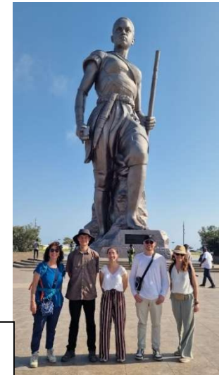
L'Amazone de Cotonou : symbole fort et féministe du pays