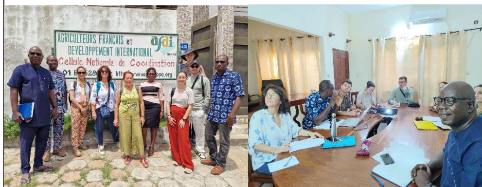
Accueil et réunion à la cellule AFDI de Cotonou

Découverte de la boutique avec ses produits locaux