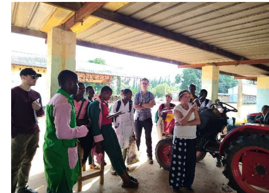
Découverte du teck et des matériels agricoles de l'exploitation du LAMS