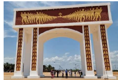
Porte du non retour de Ouidah : patrimoine mondial de l'UNESCO, symbole et mémoire de l'esclavagisme