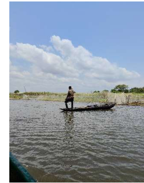
Pêche traditionnelle de Ganvié : activité essentielle nourricière et économique