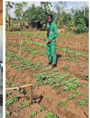
Atelier de transformation et planches maraichères (semis de basilic)