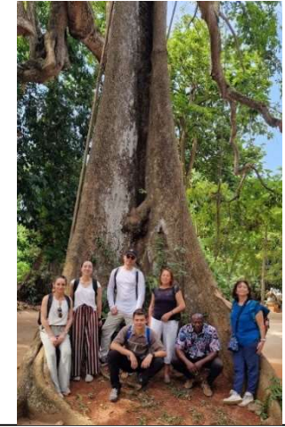
Forêt sacrée de Ouidah: patrimoine naturel, culturel et religieux